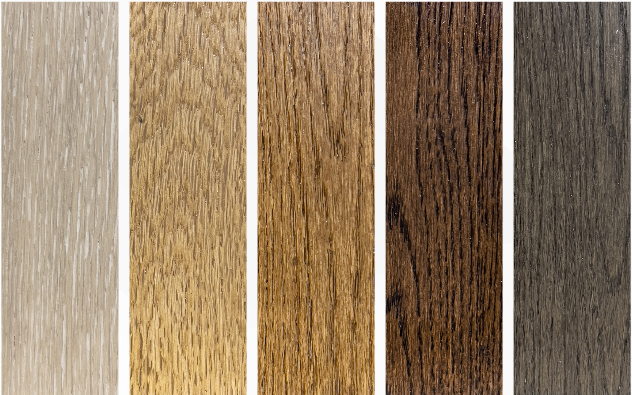
CREAMY OAK ENGW-B003